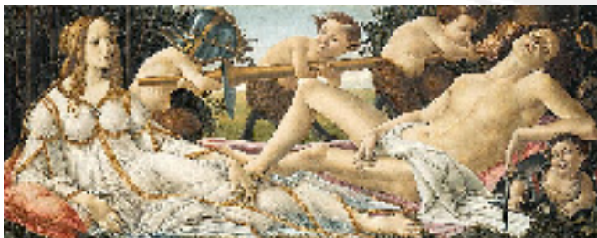
Botticelli: Venus og Mars