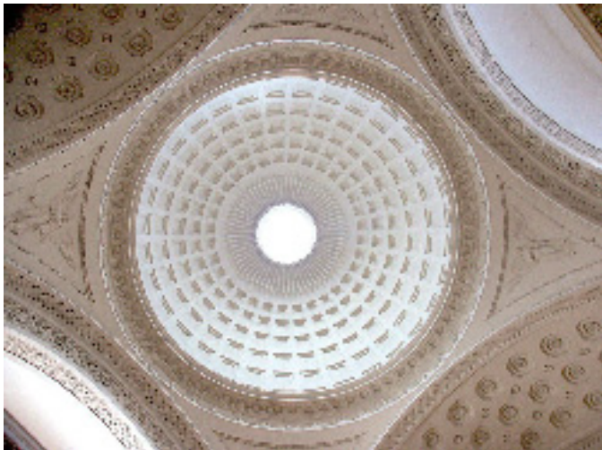
Christiansborg Slotskirke